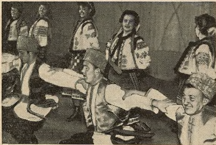
НА ЗДЫМКУ: выступае танцавальны калектыў універсітэта.

Друкарня выдавецтва БДУ імя У. І. Леніна